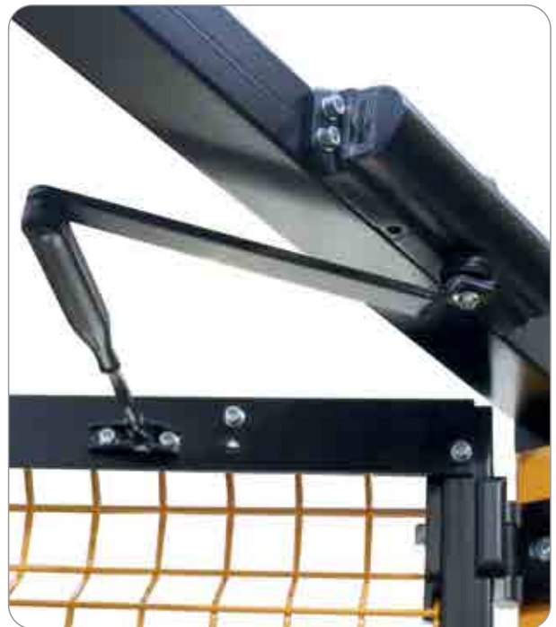
Molla di chiusura automatica per porta a battente