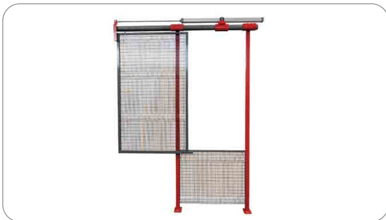
Porta speciale automatica con cilindro pneumatico