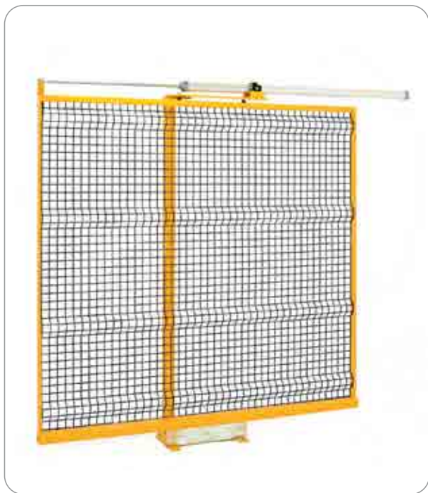
Porta scorrevole automatica con cilindro pneumatico