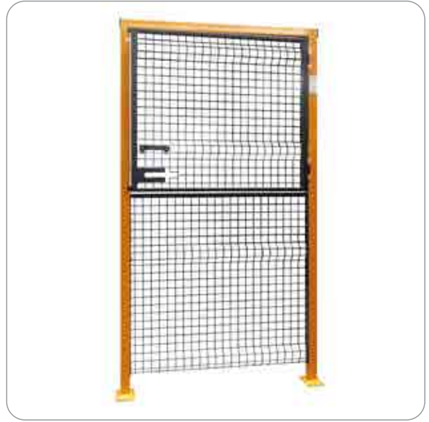
Porta con anta parziale e pannello fisso