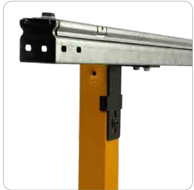
020P Supporto per canalina portacavi