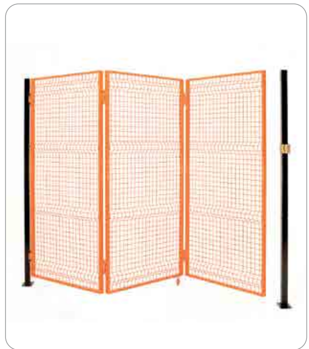
Porta a soffietto a due o più ante