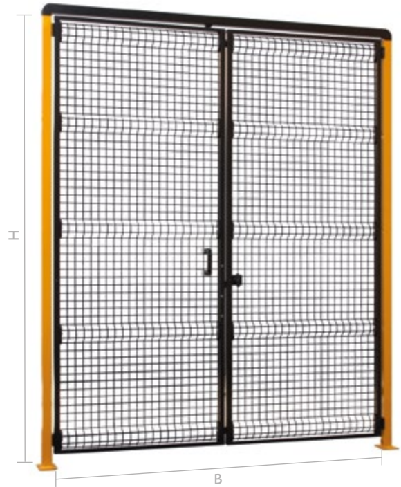
MEKKANO DOPPELTÜR MIT OBEREM QUERTRÄGER