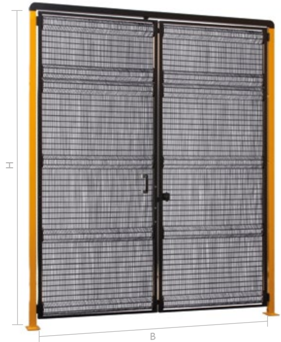
MEKKANO KRT DOPPELTÜR MIT OBEREM QUERTRÄGER