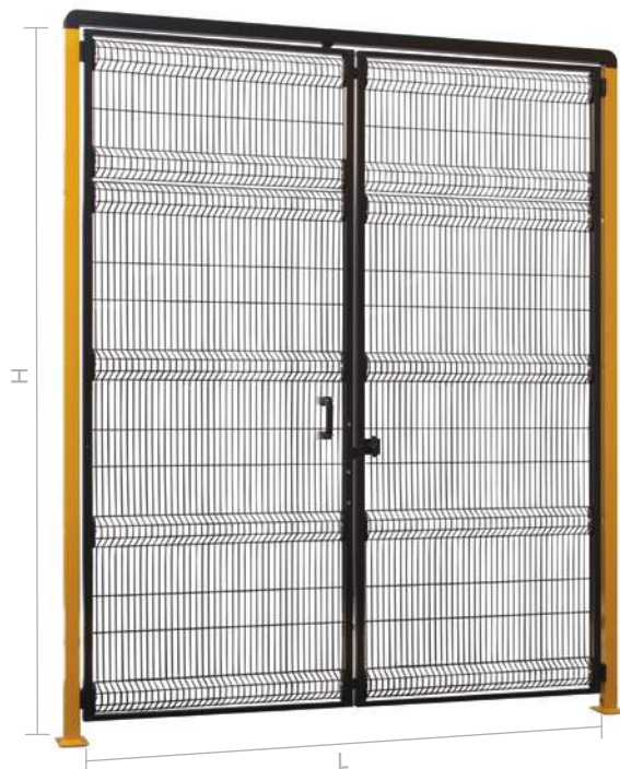
PORTA MEKKANO HD DOPPIA CON TRAVERSO SUPERIORE